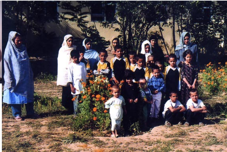
Gruppenbild vor dem neuen Zuhause.