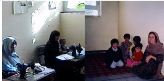
Das Waisenhaus während der Sanierung (oben links), und nach der Fertigstellung (oben und rechts).

Das Projekt Frauendorf in Kabul - Hilfe zur Selbsthilfe stärkt langfristig die Rolle der Frauen durch ökonomische Unabhängigkeit. Es ermöglicht ihnen eine Ausbildung - speziell in der Textilbranche - bietet ihnen eine aktive Teilnahme an Sozialreformen und am Wiederaufbau ihres Landes, und sichert ihnen, ihren Kindern und den aufgenommenen Waisen damit die Grundlage ihres Lebens.