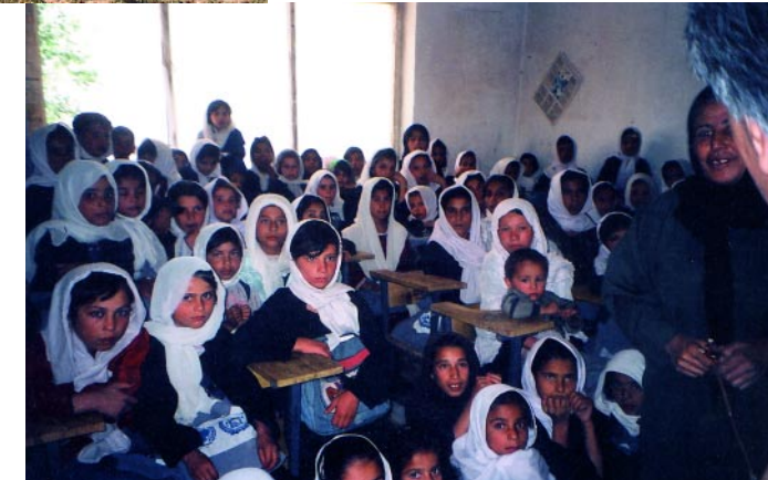
Eine Schulklasse der Dekepak-Schule.

Auf unserer Internetseite www.kufaev.de erhalten Sie Informationen über die konkreten Hilfsmaßnahmen, benötigten Hilfsgelder und über den Einsatz der Spendengelder sowie den aktuellen Stand der Entwicklung.