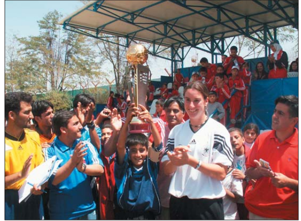
Birgit Prinz bei der Verleihung des Pokals an den Sieger des „Prinz-Parcours“

Im August hat Birgit Prinz mit uns die drei Zentren im LEARN & play-Projekt besucht, über die wir seit der In-Betriebnahme von Charikar jetzt 600 Kinder im Alter von 8–12 Jahren betreuen. Eine Mannschaft aus dem LEARN & play-Projekt ist sogar Kabuler Fußball-Meister geworden.