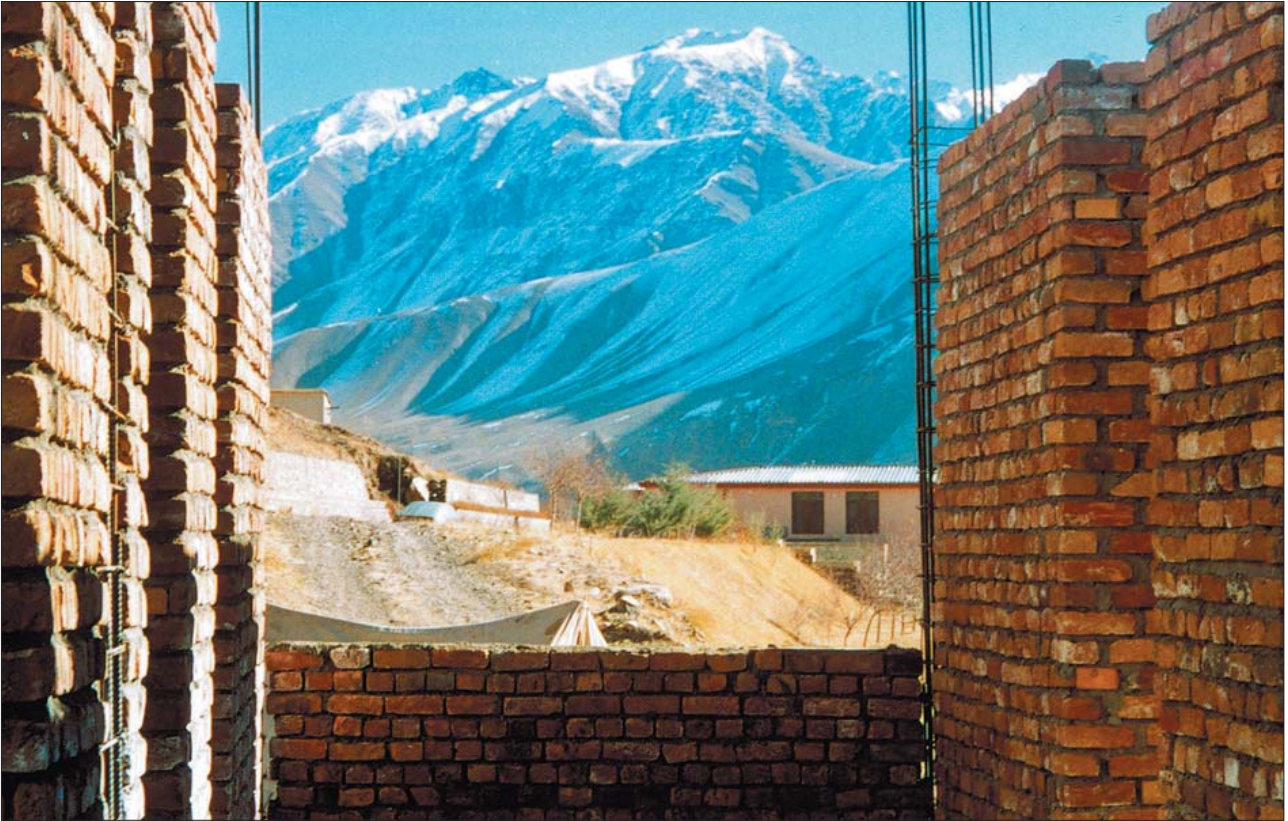
Blick durch die Säulen der Modellberufsschule für Mädchen und Jungen auf das Gästehaus der Massoud-Stiftung und das winterliche Panjshirgebirge

Der Bau der Brückenschule in Astana geht voran. Das Fundament steht, die ersten Mauern und Säulen sind gesetzt, allerdings erst nachdem wir einen herben Rückschlag in einen Vorteil umwandeln konnten.