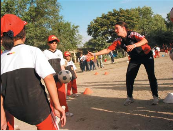
Birgit Prinz beim Anfeuern der Kinder beim „Prinz-Parcour“